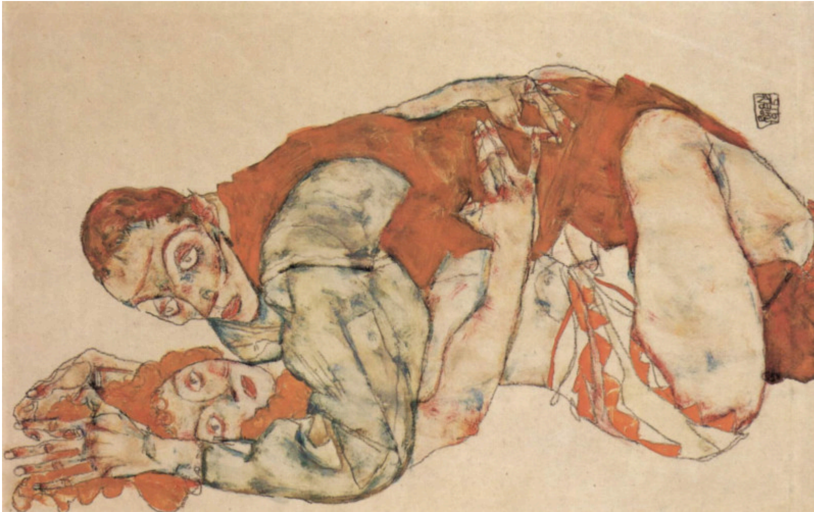
Acto de amor, 1915. Obra de Egon Schiele.

Nace Fundación Contexto y Acción, una entidad sin ánimo de lucro y con un fin social: defender los DDHH y fortalecer la democracia a través de la información veraz. Necesitamos tu ayuda, puedes donar aquí y desgravar un 80% en tu próxima declaración del IRPF.